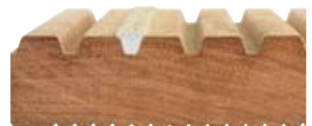
Detail von SafeGrip®